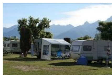
Camping « Rive-bleue »

Abri PC : Réalisés dans la perspective d'un conflit armé, les ouvrages de protection doivent également pouvoir servir d'hébergement de fortune lors de catastrophes et de situations d'urgence. Les abris PC servent également à héberger des gens lors de manifestation telle que notre rencontre francophone.